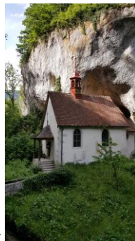
wandern durch die Verenaschlucht