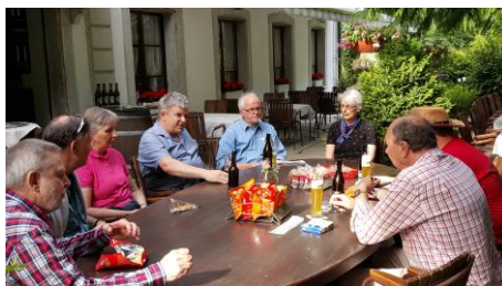
beim gemütlichem Abendessen